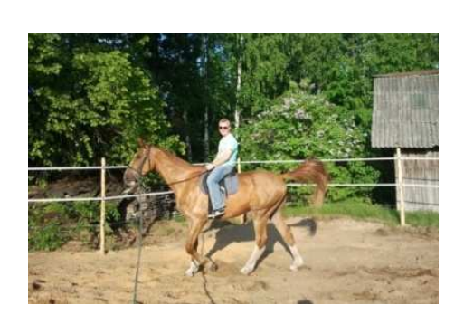
Turki – Sutri ≈ 39 km

"Jaungrāveri", Grāveri, Jersikas pag., Līvānu novads, Latvija, LV-5316;GPS: 56.3319949, 26.1837615; tālr.: +371 26070822; <u>zane.gaiduka@gmail.com</u>; Skype: zane.gaiduka