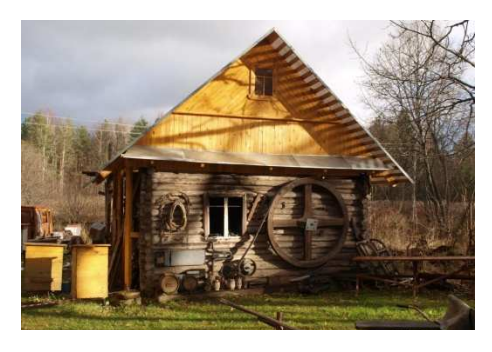
Tour de Latgale & Pskov ELRI - 129

Dubrovka, Pečoru rajons, Pleskavas apgabals, Krievija; GPS: 27.718265, 57.701644; tālr.: +7-911-351-46-54; www.paseka-glazova.narod.ru/museum.html