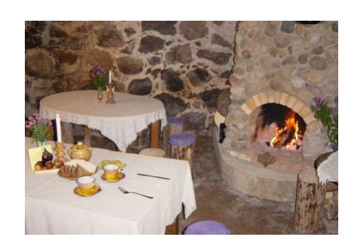
Aglona – Gūteņi ≈ 3 km