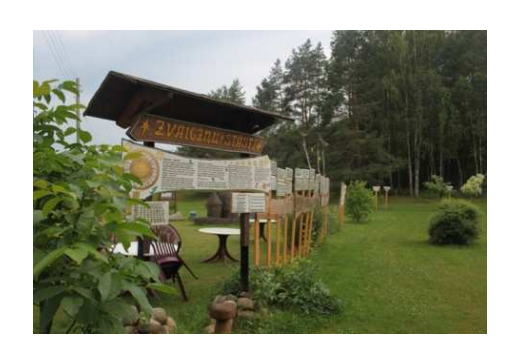
Gūteņi – Vortņiki ≈ 25 km

Eko saimniecība, horoskopu parks. Pirts ar smaržīgām slotiņām, masāžas, zāļu tējas. Iespēja nobaudīt Latgales kulinārā mantojuma ēdienus. Bērniem - saimniecībā esošo dzīvnieciņu apskate. Apmeklējums pēc pieteikuma. Gūteņi, Aglonas pagasts, Aglonas novads, Latvija, LV-5304; GPS: 56.094257, 26.933670; tālr.: +371 29234425; mob.: +371 28350601; meziniekumajas@inbox.lv, www.meziniekumajas.viss.lv